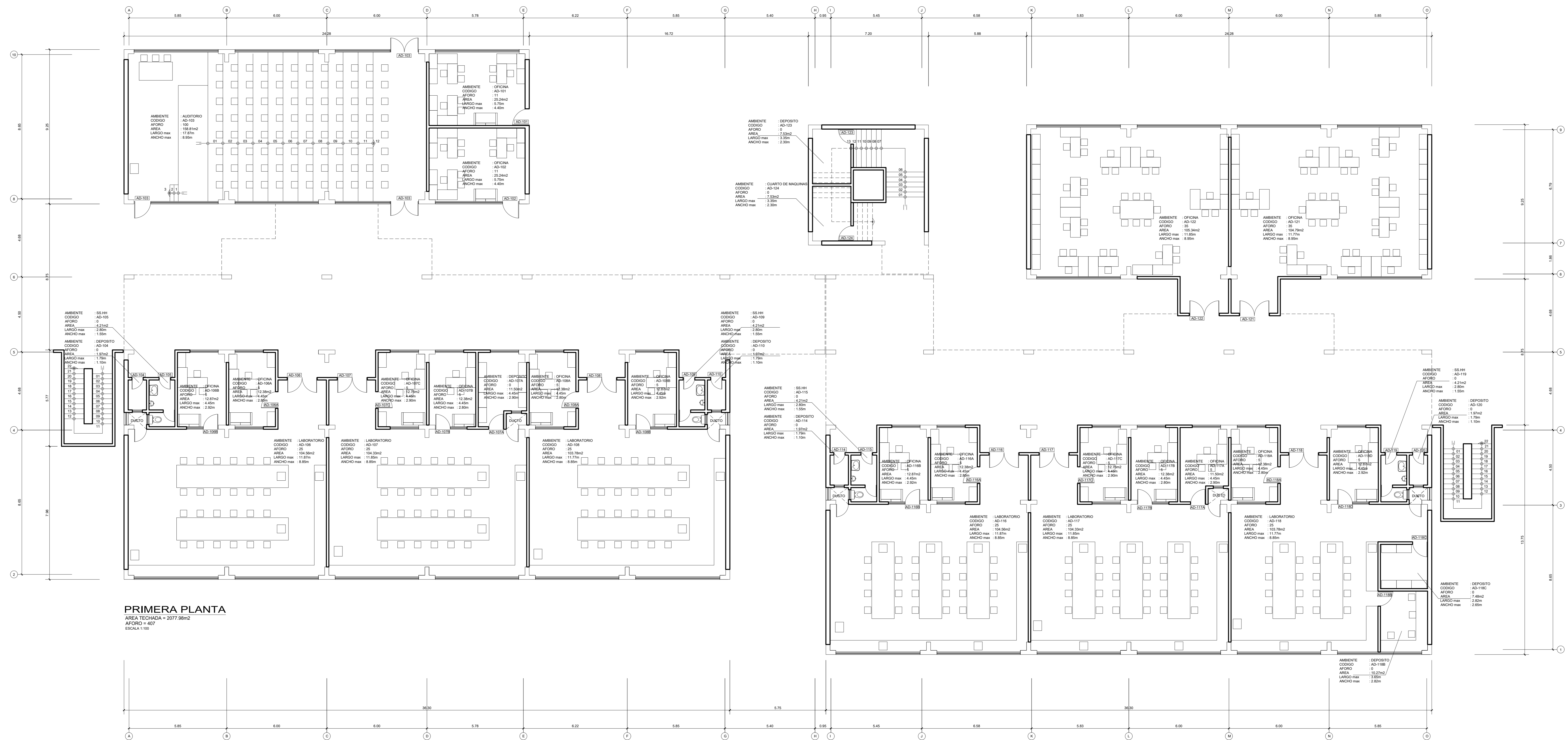
PRIMERA PLANTA AREA TECHADA = 2077.98m 2 AFORO = 403 ESCALA 1:100